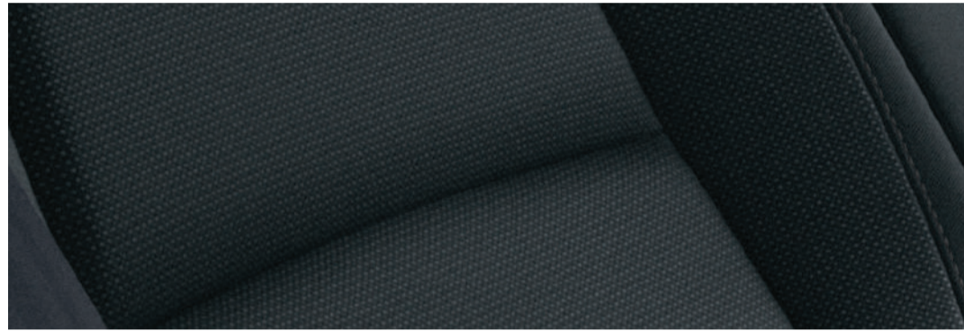
Versión i - i Sport