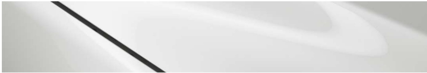
Blanco Aperlado Mica