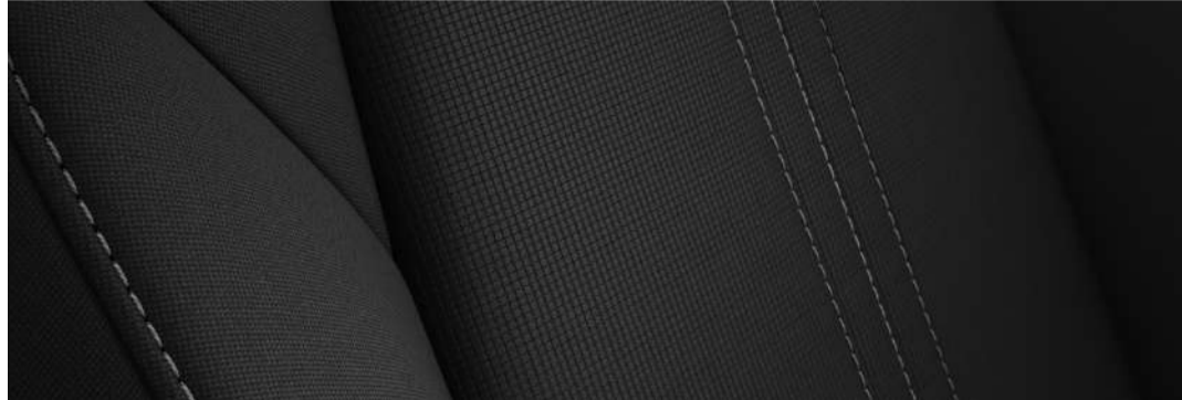
Versión i Sport