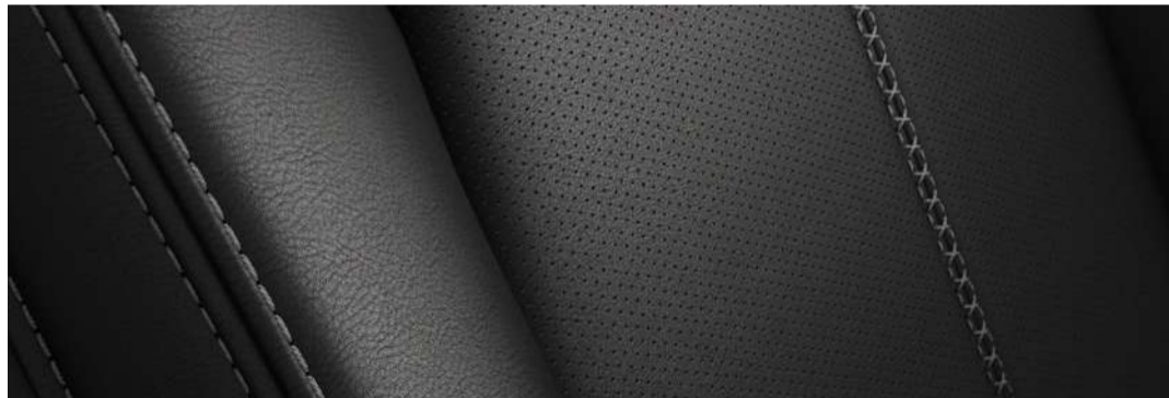
Versión i Grand Touring