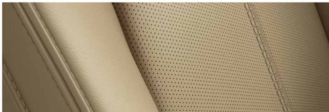
Versión i Grand Touring